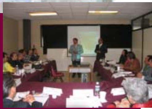
Eventos de Comité Interno y Externo