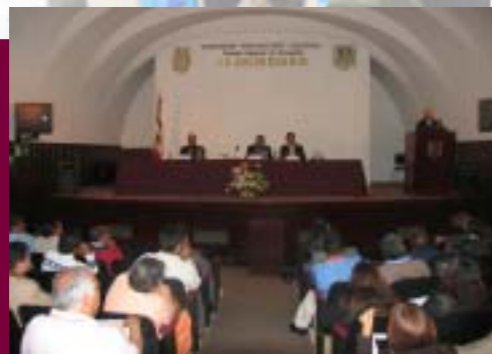
Evento en la Escuela Superior de Economía