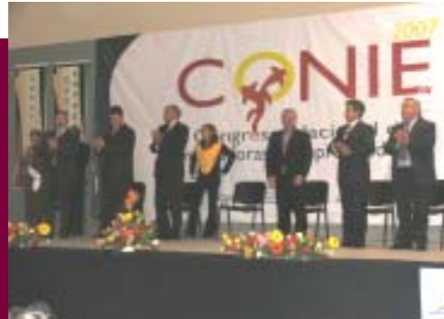
Evento CONIE 2007