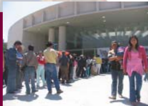
Evento CONIE 2007