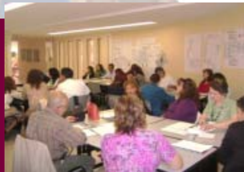
Curso Mapeo y Documentación de Procesos

Se llevó a cabo el tercer curso de "Introducción a las Finanzas Populares y Microfinanzas", en el que se formaron 62 estudiantes de los últimos semestres y ocho profesores del IPN; participaron además cinco profesores del Colegio de Posgraduados Campus Montecillo , del Edo. de México; uno de la Facultad de Estudios Superiores Acatlán de la UNAM; dos del Programa Nacional de Financiamiento al Microempresario (PRONAFIM) de la Secretaría de Economía. Con el apoyo de la USAID/AFIRMA, participaron instructores expertos internacionales, además de representantes de Instituciones Microfinancieras. Asimismo, el IPN en colaboración con la USAID/AFIRMA convocó a la Primera Reunión de Universidades y Microfinanzas.