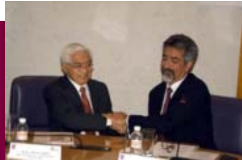
Firma de Convenio General de Colaboración entre el CENAM y el IPN