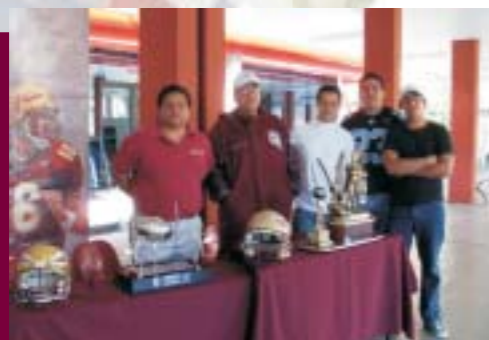
Equipo de Fútbol Americano "Siux"