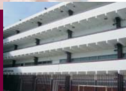
Instalaciones del Centro