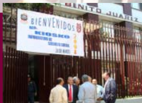
Actividades en el CECyT "Benito Juárez"