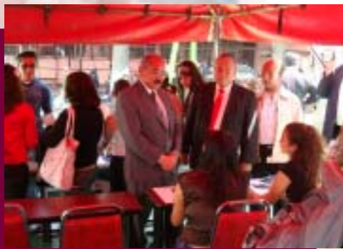
Actividades en el CECyT "Benito Juárez"

En construcción, adecuación, mantenimiento y equipamiento de instalaciones académicas y administrativas, se llevaron a cabo acciones de acuerdo a las necesidades y calendario de medidas preventivas y correctivas de las instalaciones académicas y administrativas.