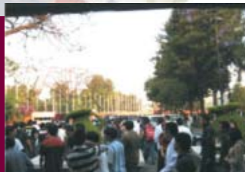
Simulacro de Evacuación