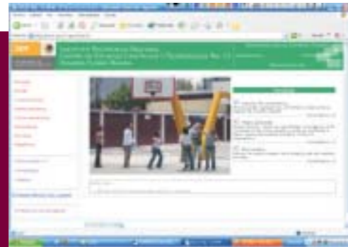
Página Web del Centro