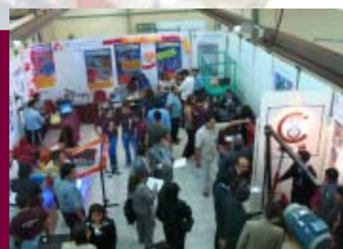
Inauguración del Concurso de Prototipos

Participaron 176 alumnos en 18 concursos académicos, destacando la obtención de los primeros lugares en Dibujo Técnico, Geometría y Trigonometría, Entorno Socioeconómico de México y la mejor tesis del NMS.