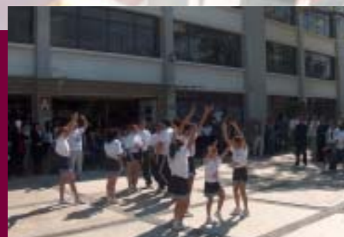
Segunda Caravana de la Salud Integral