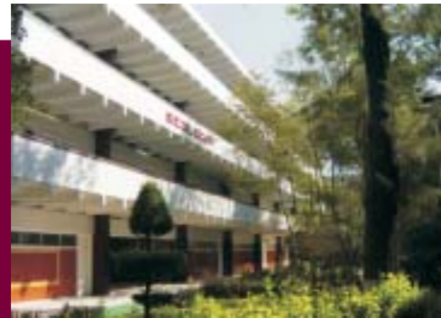
Instalaciones del Centro