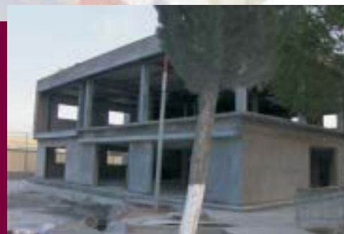
Ampliación de la Biblioteca del Centro