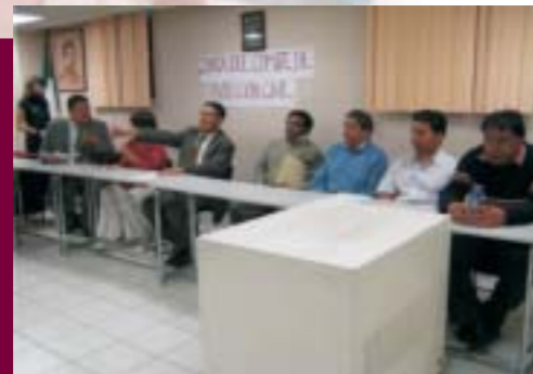
Comité de Seguridad y Contra la Violencia