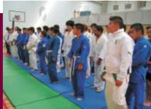
Concurso Interpolitécnico de Judo