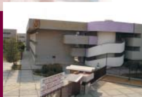
Instalaciones del Centro