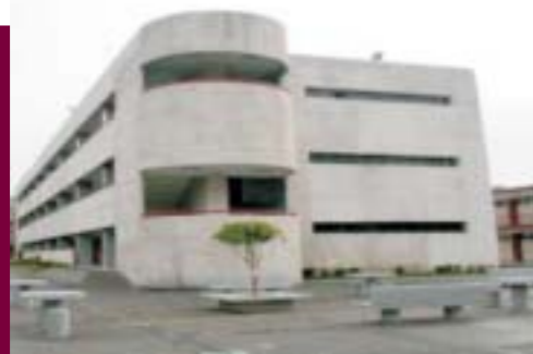
Instalaciones del Centro