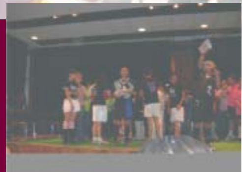
Evento "Liga de Improvisación"