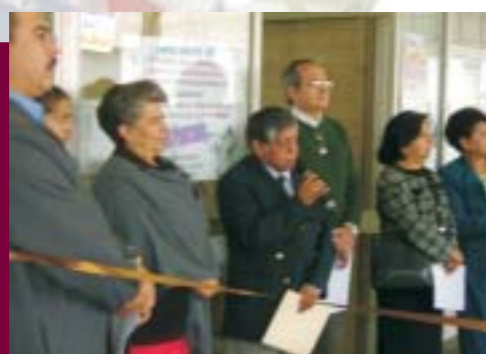
Feria de la Salud