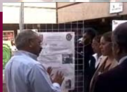
Programa Institucional de Tutorías