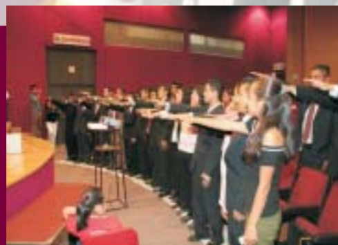
Ceremonia de Titulación