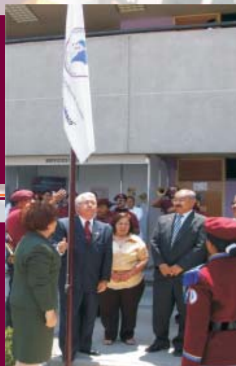
Declaratoria de "Escuela Libre de Humo de Tabaco"