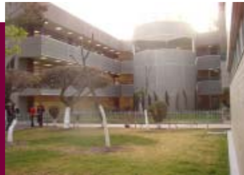
Instalaciones del Centro