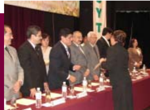
Ceremonia de Titulación