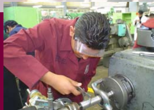
Actividades en Talleres