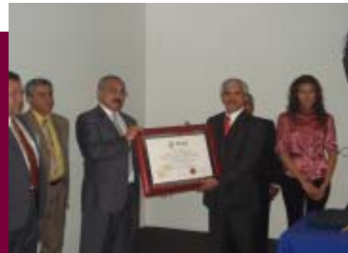
Entrega del Certificado ISO 9001:2000