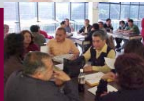
Entrega del Certificado ISO 9001:2000