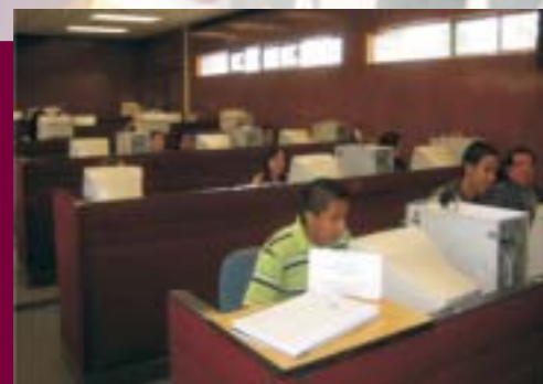
Área de Cómputo

Se inició el diseño del plan de la Carrera de Administración en modalidad virtual, participando cinco docentes en la elaboración de programas, se realizaron cinco acciones de actualización y capacitación y se conformó un grupo de 24 profesores para participar como asesores y tutores en línea.