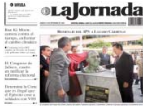
Encabezado del Periódico La Jornada