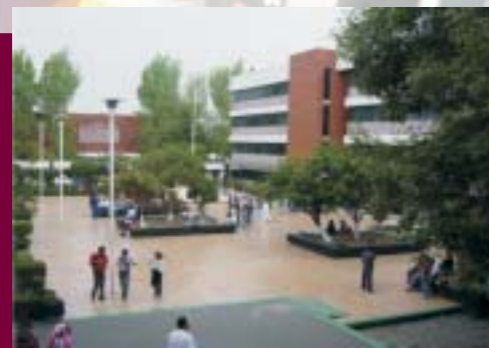
Instalaciones del Centro