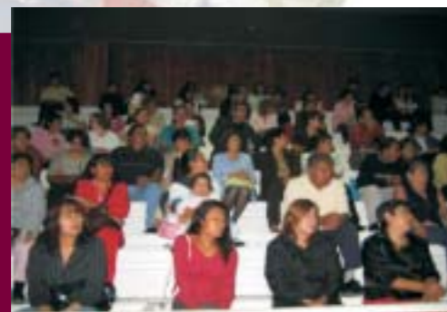
Evento de Orientación Juvenil

Relación con los egresados, su seguimiento y evaluación: