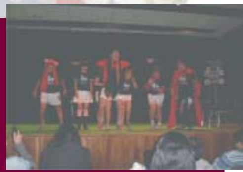
Evento "Liga de Improvisación"