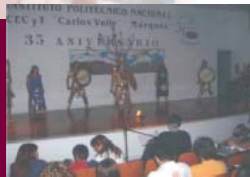
Obra "Leyendas Mexicanas"