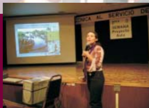
Conferencia sobre Calentamiento Global