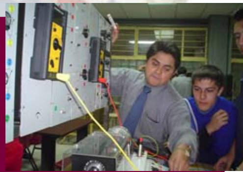
Actividades en Talleres