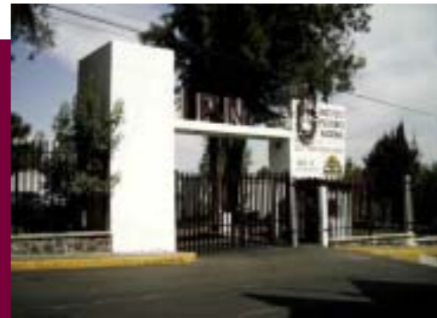
Instalaciones del Centro