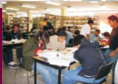
Biblioteca del Centro