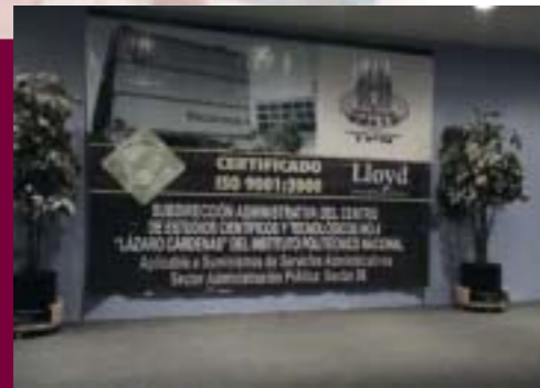
Entrega del Certificado ISO 9001:2000