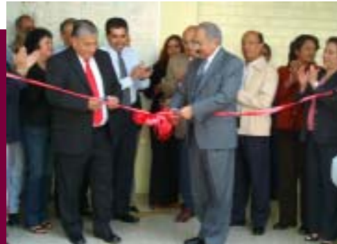
Actividades en el CECyT "Benito Juárez"