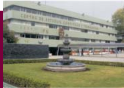
Instalaciones del Centro