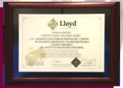
Entrega del Certificado ISO 9001:2000