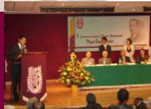
Entrega de la Presea "Miguel Bernard Perales"

En el periodo tres carreras fueron evaluadas y acreditadas.