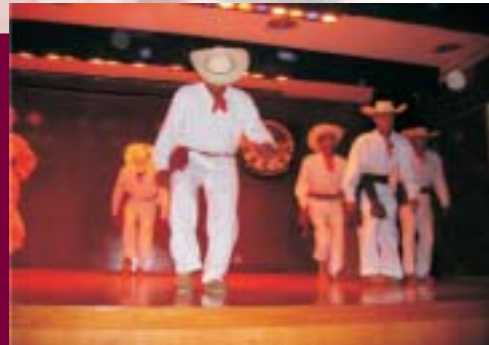
Compañía de Danza Folklórica del IPN