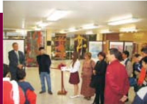
Exposición de David Sefami