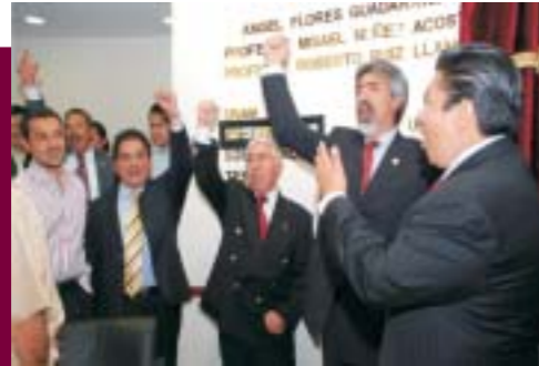
Develación de Letras Doradas "IPN-CECyT 3" Salón de Cabildo del Municipio de Ecatepec