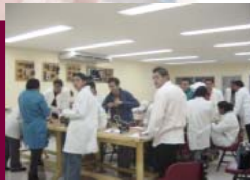
Actividades en el Taller de Control