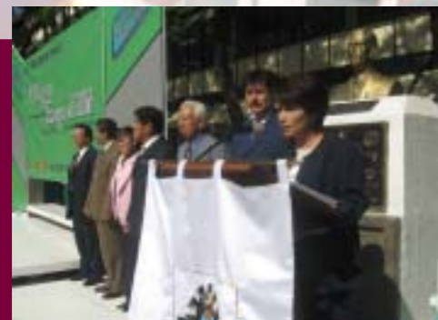
Magna Expo 2008