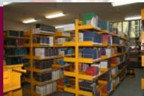
Biblioteca de la ESEO