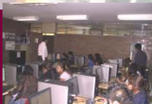
Actividades Académicas en la ESE