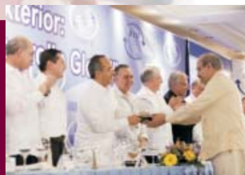
Premio Nacional de Exportación 2007