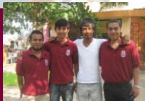
Encuentro Nacional de Estudiantes de Arquitectura