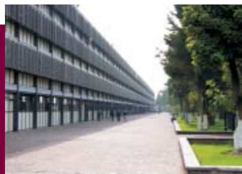
Instalaciones de la ESIA Zacatenco