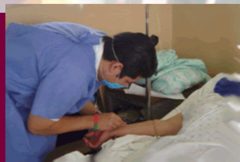
Laboratorio de Enfermería