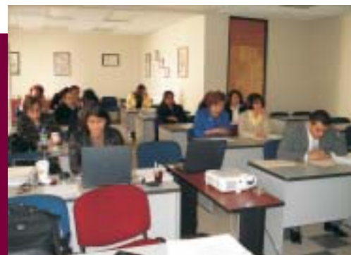
Proceso de Certificación