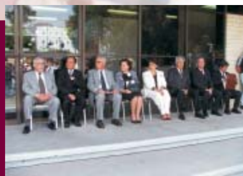
Autoridades de la ESFM

Se reconstruyeron los sanitarios en los Laboratorios de Física y se colocó piso en el pasillo del Edificio de Gobierno.