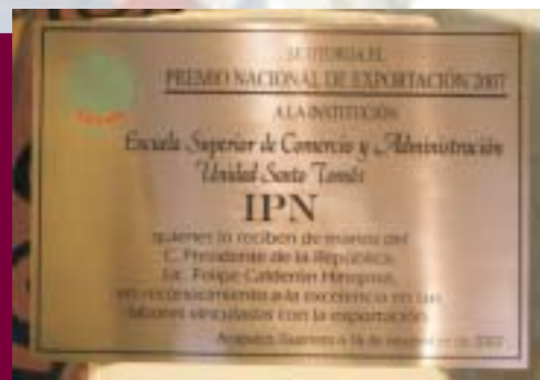
Premio Nacional de Exportación 2007