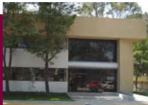
Instalaciones de la ESIME Azcapotzalco