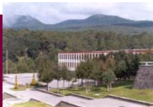
Instalaciones del CICS Milpa Alta