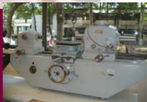
Equipo para Prácticas

Se realizaron pruebas de tensión y de análisis químico a la empresa VALSA, S.A. de C.V., pruebas de compresión, tensión y corte a Tableros Honey Comb , S.A. de C.V. y Grupo Gysapol, S.A. de C.V., diagnóstico del estado en que se encuentra el laboratorio de prótesis y clínica dental del CONALEP en el Estado de México, capacitación a personal de la Organización de las Naciones Unidas (ONU).