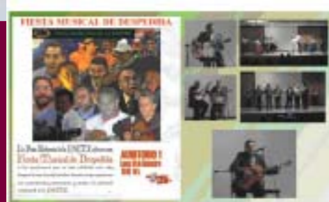
Evento Especial de Despedida de Profesores Jubilados