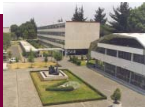
Instalaciones de la Escuela