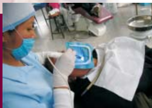
Práctica Clínica en Odontología

Se realizó una modificación de espacios físicos en el laboratorio de técnicas culinarias. También se adecuaron y habilitaron las áreas de fotocopiado y prefectura, y se adecuó un espacio físico en el edificio 47.