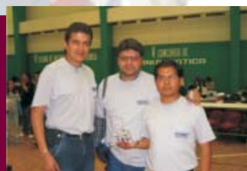
V Concurso de Mini Robótica