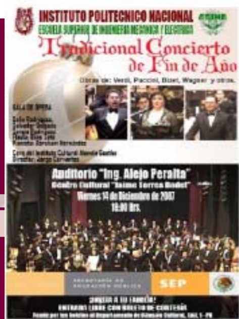
Concierto de Fin de Año para la Comunidad de la ESIME Zacatenco, realizado en el Auditorio "Ing. Alejo Peralta" del Centro Cultural "Jaime Torres Bodet"