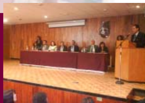
Evento en la ESIT

Se realizó la adecuación para el nuevo laboratorio de Microscopía, la instalación eléctrica de un cubículo y se dio mantenimiento a las diferentes áreas del plantel.