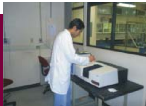
Cromatógrafo de Gases