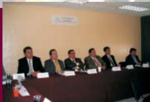
Firma de Convenio de Atlas de Riesgo del D.F.