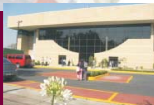
Gimnasio de la UPIICSA