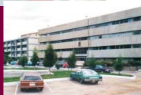
Aulas y Laboratorios