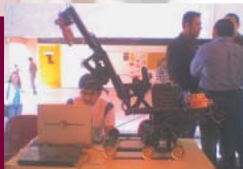
Curso de Mini Robótica

Se encuentran registrados 20 docentes como miembros del Sistema Nacional de Investigadores (SNI).