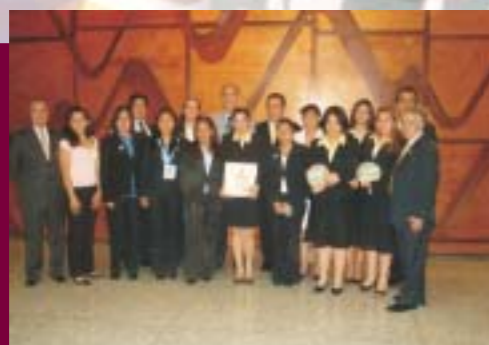
2a. Expocreatividad Regional Emprendedora 2008