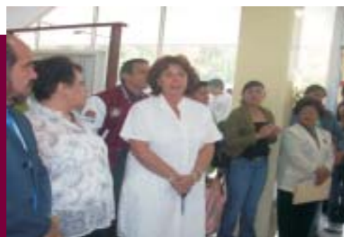
Inauguración de la Primera Exposición de Pintura y Artes Plásticas