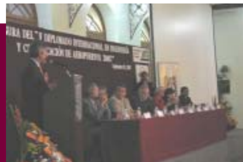
Clausura del V Diplomado en Ingeniería y Certificación de Aeropuertos