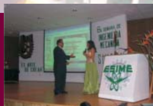
8ª Semana de Ingeniería Mecánica