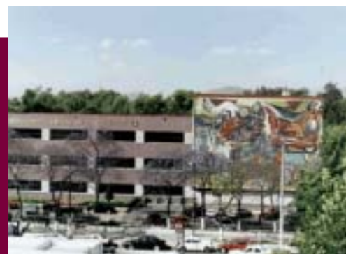
Instalaciones de la ESEO