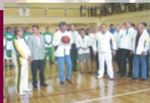
Inauguración del Gimnasio