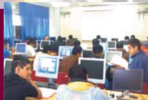
Centro de Cómputo