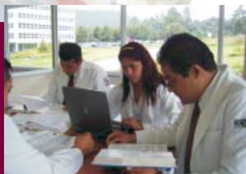
Biblioteca del CICS Milpa Alta