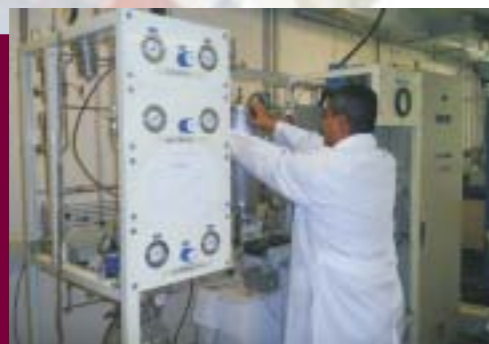
Planta de Micro-Reacción

Vinculación con los sectores social y productivo: