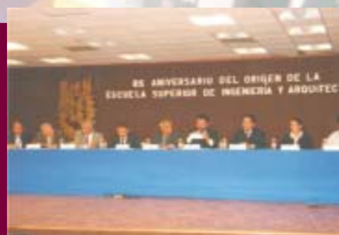
85 Aniversario de la ESIA Zacatenco