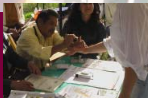
Tinta Indeleble Utilizada en las Elecciones en el Estado de Chiapas