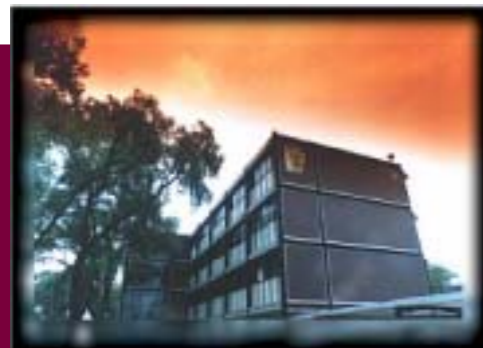
Instalaciones de la ESFM