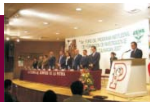
Foro del Programa Institucional de Formación de Investigación