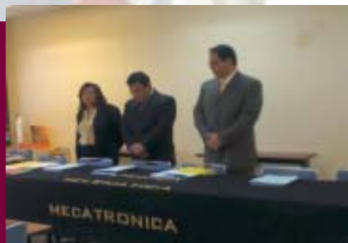
Diplomado en Actualización y Formación Docente