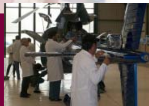
Práctica de Mantenimiento de Aeronaves