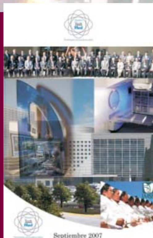
Premio "TECHMED 2007"