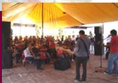
Eventos Culturales en ESCOM