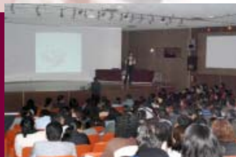
Yvonne Domenge en la ESIA Tecamachalco

Enseñanza de lenguas extranjeras: 483 alumnos fueron atendidos en los idiomas Inglés, Francés e Italiano.