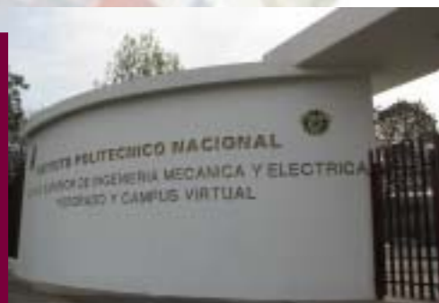
Edificio de Posgrado y Campus Virtual