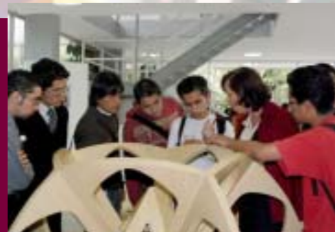
Exposición Escultórica de Yvonne Domenge