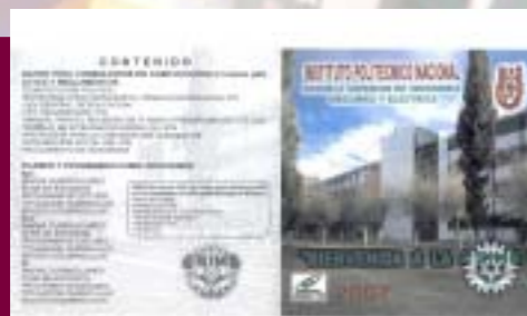
Disco de Bienvenida para los Alumnos de Nuevo Ingreso