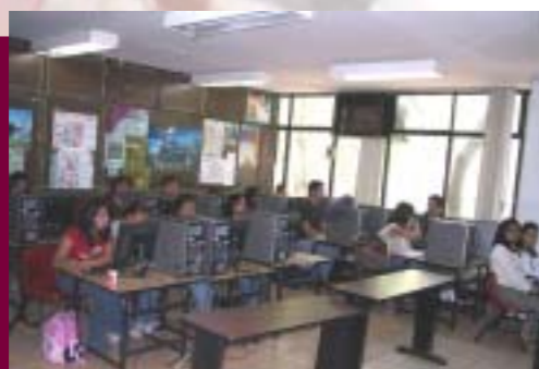
Actividades Académicas en la ESE