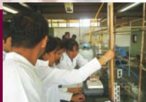
Laboratorios de Físico Química

Relación con los egresados, su seguimiento y evaluación: se atendieron 2,931 usuarios politécnicos, se captaron 50 empleos y se registraron 576 egresados más.