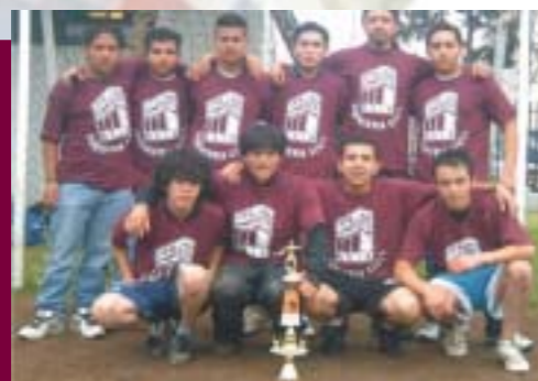
Campeonato Estudiantil de Nuevos Valores