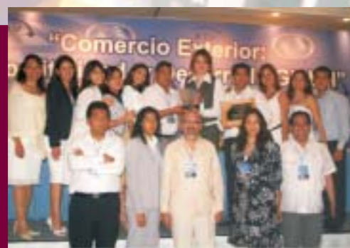
Premio Nacional de Exportación 2007