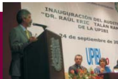
XX Aniversario de la UPIBI Inauguración del Aud. "Dr. Raúl E. Talán Ramírez"