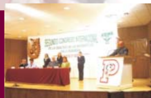
2º Congreso Internacional de la Didáctica de las Matemáticas en la Ingeniería

Se realizaron adecuaciones y modificaciones en la sala de profesores, sala de audioconferencia y videoconferencia, área de orientación juvenil, coordinación del CELEX, sanitarios en la cafetería y edificio de gobierno, cuarto de bombas, librería en el edificio dos y área de relaciones públicas. Se adaptaron las instalaciones eléctricas de diversas áreas de la Escuela.