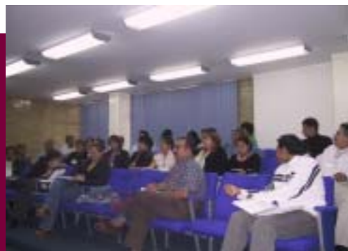
Actividades Académicas en la ESE