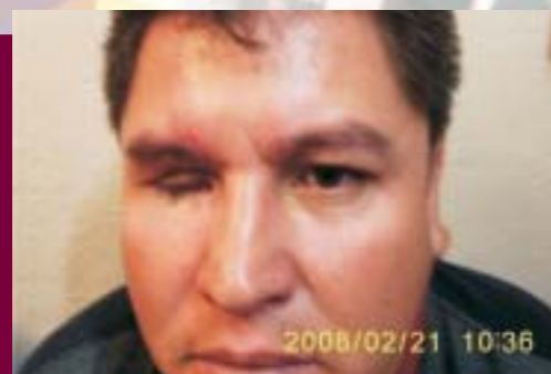
Adaptación de Prótesis Oculares