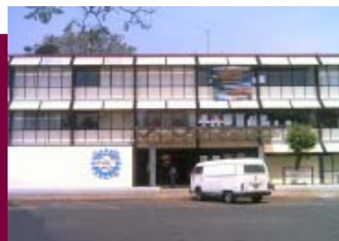
Instalaciones de la ESIT