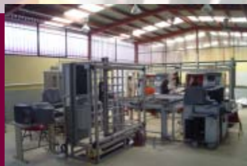
Área de Laboratorios