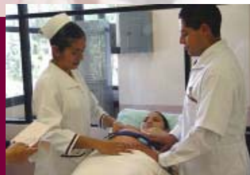
Laboratorio de Enfermería