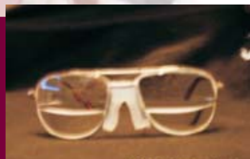
Lentes oftálmicos para la observación de objetos pequeños a corta y mediana distancia

Se publicaron artículos y extensos en el diario La Crónica de Hoy , Revista Opción y en la Gaceta Politécnica.