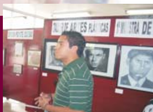
Primera Exposición de Pintura y Artes Plásticas