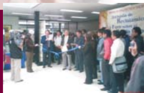
Jornada de Reclutamiento y Foro sobre el Mundo Laboral