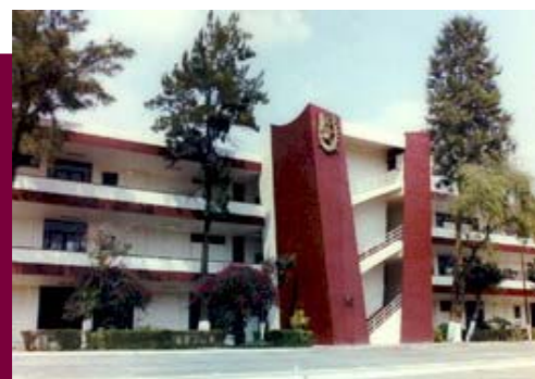
Instalaciones de la Escuela