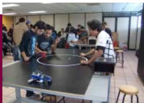
Concurso de Mini Robótica 2008