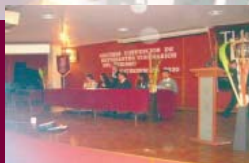
2ª Convención de Estudiantes y Exalumnos Visionarios en Turismo