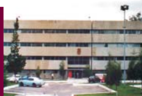
Instalaciones de la ESIA Unidad Ticomán