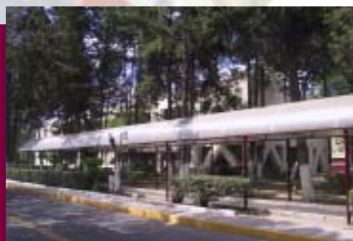
Andador Construido en la Escuela