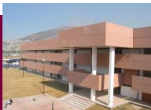
Instalaciones de la Unidad