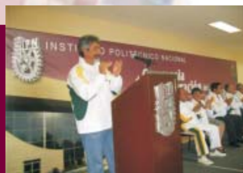
Inauguración del Gimnasio