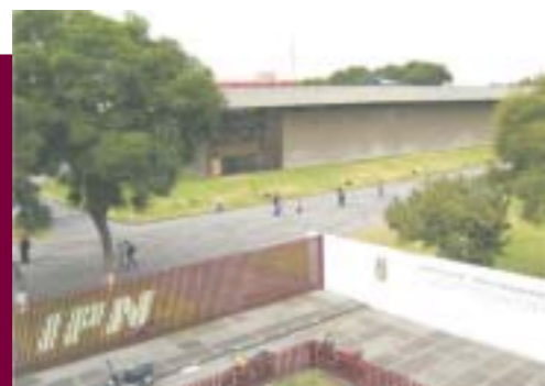
Instalaciones de la UPIICSA