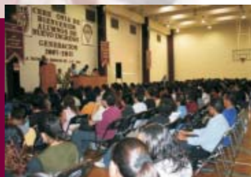
Curso de Inducción Alumnos de Primer Ingreso

Enseñanza de lenguas extranjera: se atendieron 18,535 alumnos en cursos de los idiomas Inglés, Francés, Alemán e Italiano; egresaron 526 alumnos.