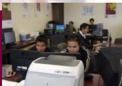
Alumnos del Proyecto Atlas de Riesgo

Se realizó el Programa de Separación de Residuos y Recolección de Tonners, para el fomento del reciclaje en la comunidad de la Escuela.